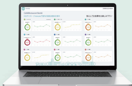
各部屋のCO2濃度・温湿度表示 <イメージ>

スポーツジムや各種レジャー施設等における各部屋のCO2情報・温湿度が遠隔監視可能。また、GwayEsのLEDはCO2濃度に応じて色が変わるので、その場でCO2濃度の状況を確認する事が可能です。