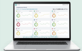
各部屋の CO2 濃度・温湿度表示 <画面はイメージ>