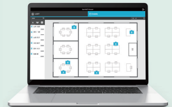
各部屋の人・物の位置表示 <画面はイメージ>