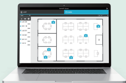
共用機器や共有資産の位置情報可視化 <イメージ>

会社や学校、病院などの共用する機器や機材、空港の手荷物カートのような不特定箇所に移動する資産の管理にも利用いただけます。